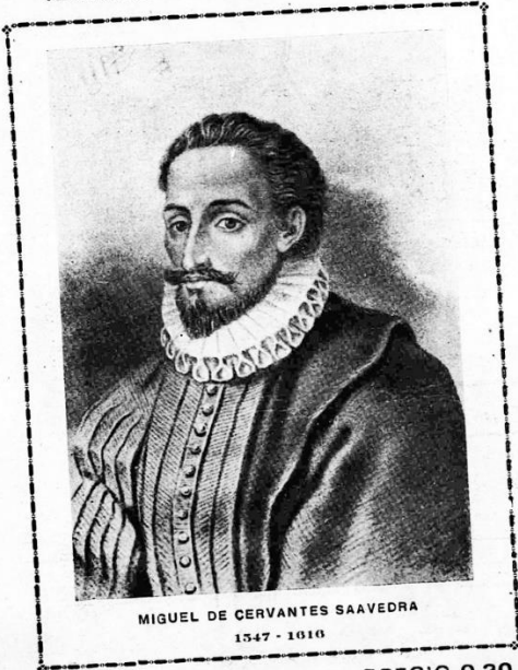
MIGUEL DE CERVANTES SAAVEDRA 1547 - 1616